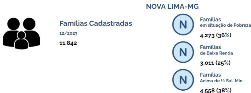
Imagem 1: Consulta em https://aplicacoes.cidadania.gov.br em 14 de fevereiro de 2024

Sendo demonstrado de forma mais detalhada na imagem abaixo.